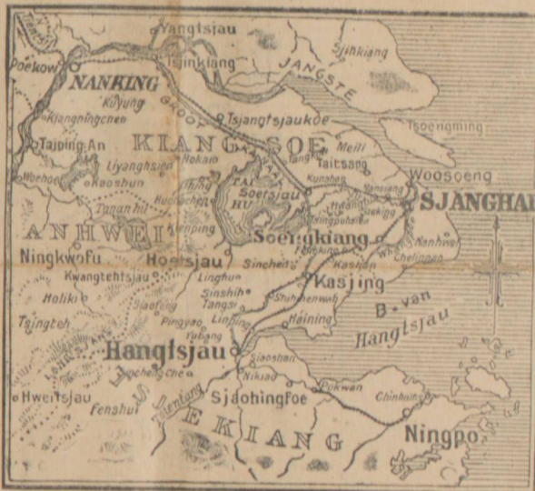
Menoeroet kawat dari ini hari Djepang aken lakoeken gerakan di Ningpo dan Wenchow (jang letaknja di bawahnja Ningpo) katanja boeat stop pengiriman barang barang ka Chungking.